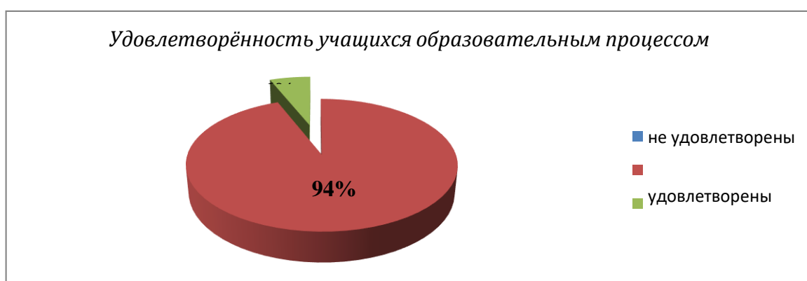
«Удовлетворённость образовательным процессом»