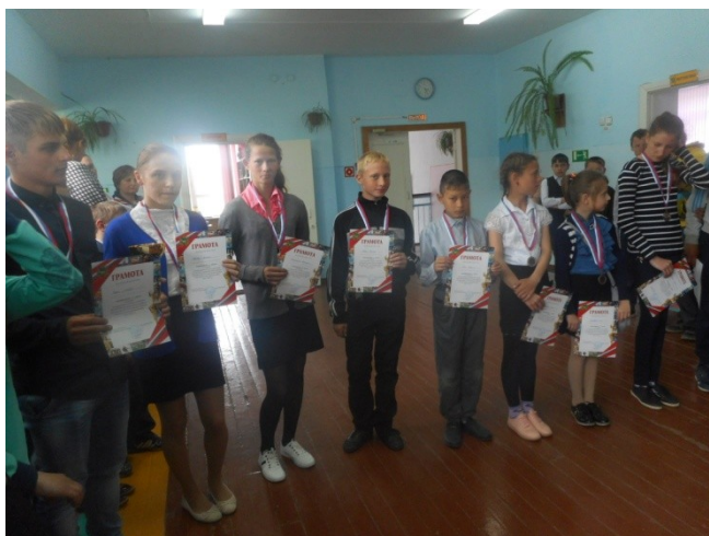
Спартакиада школьников по легкой атлетике-1место