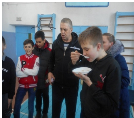
Конкурс «Будущий солдат»